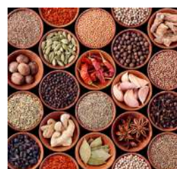
Kruiden, Specerijen & Oliën