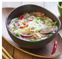
Noedels & Vermicelli