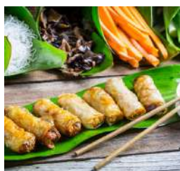
Kant & klaar producten