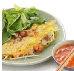
Rijst & Deegwaren