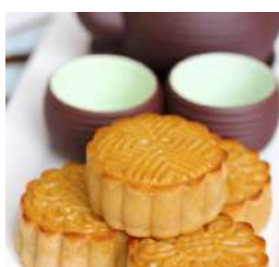
Koek & Snoep