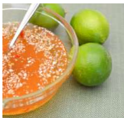
Sauzen & Pasta

Informeer ook naar onze andere overheerlijke Aziatische producten