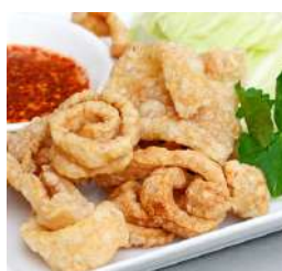
Chips & Snacks